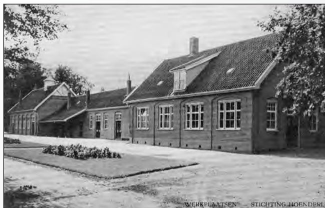
WERKPLAATSEN - STICHTING HOENDERLOO