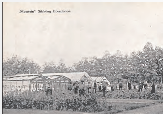
„Moestuin“. Stichting Hoenderloo.