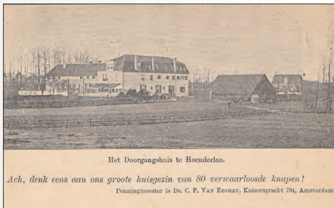
Het Doorgangshuis te Hoenderloo.

Ach, denk eens aan ons groote huisgezin van 80 verwaarloosde knapen!