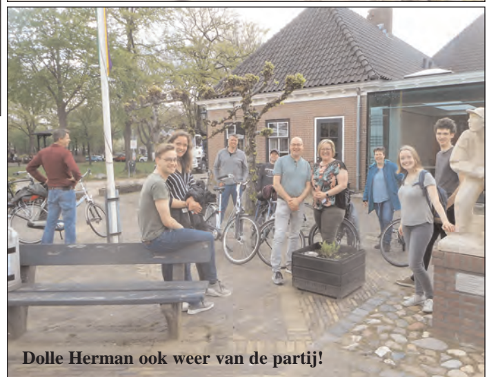
Dolle Herman ook weer van de partij!