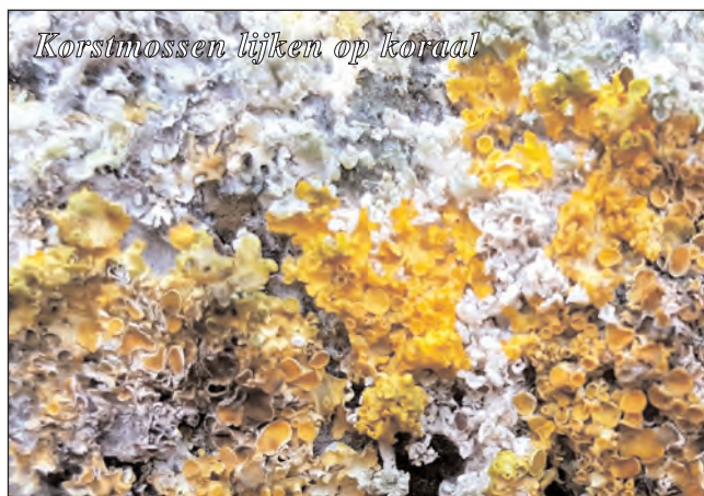
Korstmossen lijken op koraal

oog probeer ik namelijk altijd te ontdekken welke bijzondere creaties moeder natuur voor ons bedacht heeft, en