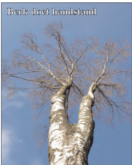
Berk doet handstand

Slakken, spinnen, libellen, kikkers, pad-