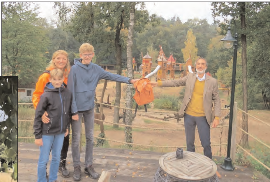
bedrijf, Landal Miggelenberg.