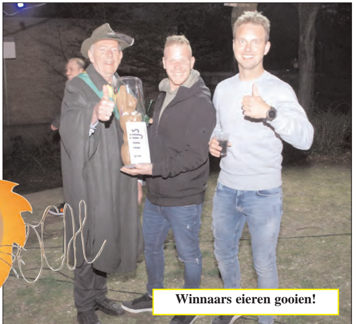
Winnaars eieren gooien!