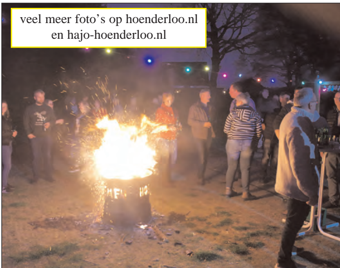
veel meer foto's op hoenderloo.nl en hajo-hoenderloo.nl